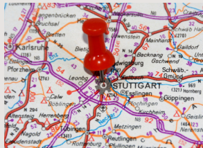
Städte & Kommunen