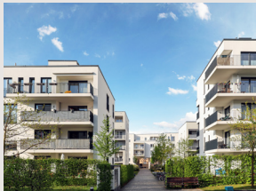
Haus & Heim