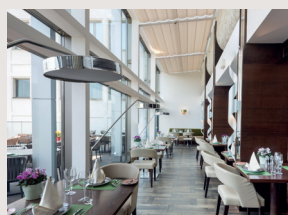
Hotellerie & Gastronomie