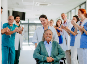
Pflege & Gesundheit