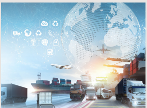
Transport & Logistik