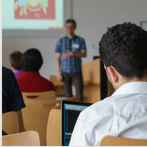
Workshops & Vorträge