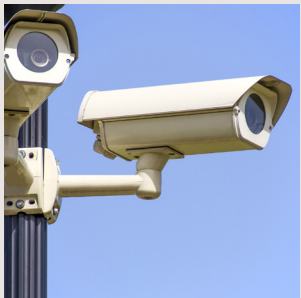
Monitoring / Schädlingsprävention